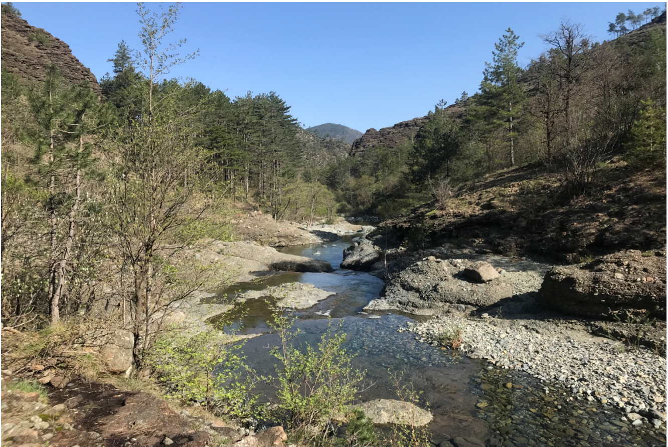
Canyon Val Gargassa