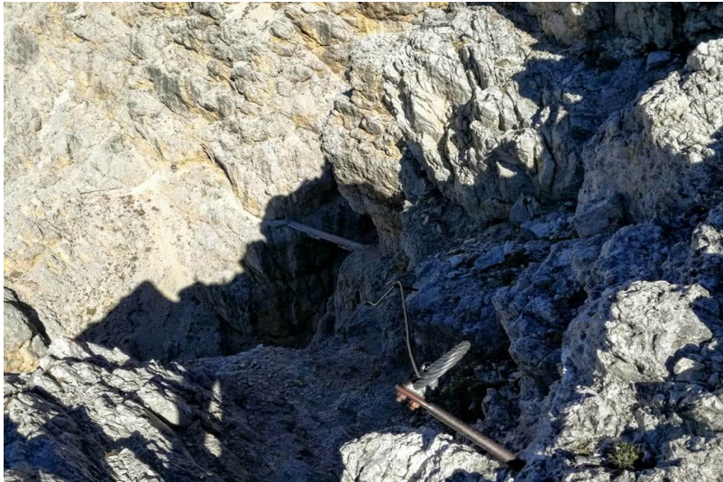
Sentiero EEA Kaiserjäger